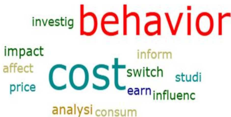
Figura 1 - Nuvem dos principais termos referentes aos títulos dos artigos.

De forma introdutória a esta seção, optou-se por construir uma nuvem com os principais temas referentes ao título dos artigos que envolvem a temática, comportamento dos custos, conforme se observa na Figura 1.